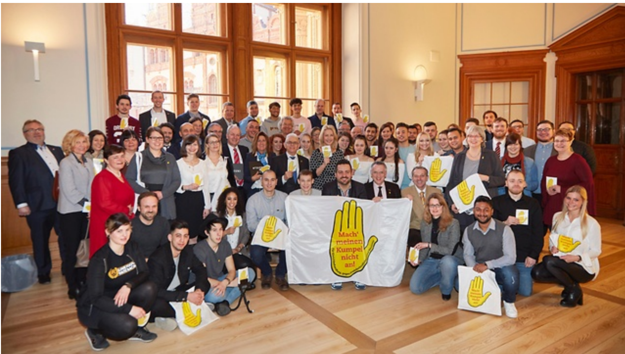
Die Teilnehmer des Wettbewerbs gegen Rassismus bei der Preisverleihung.